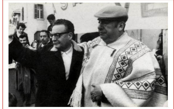
Salvador Allende insieme al grande poeta cileno Pablo Neruda.