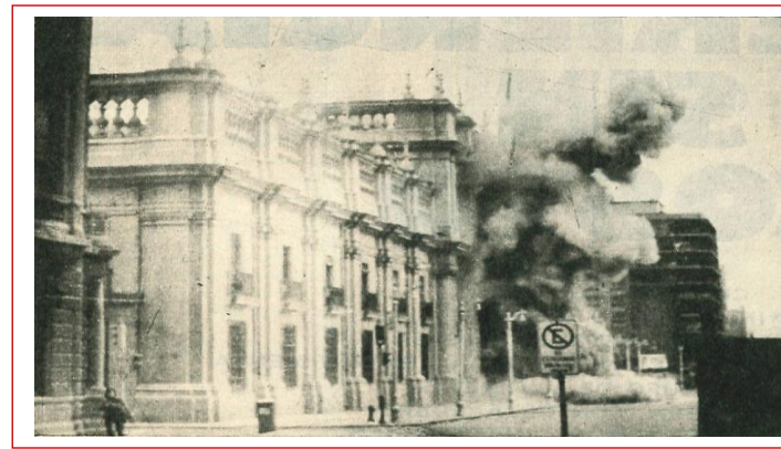
L'attacco dei militari di Augusto Pinochet al palazzo della Moneda, avvenuto l'11 settembre 1973.